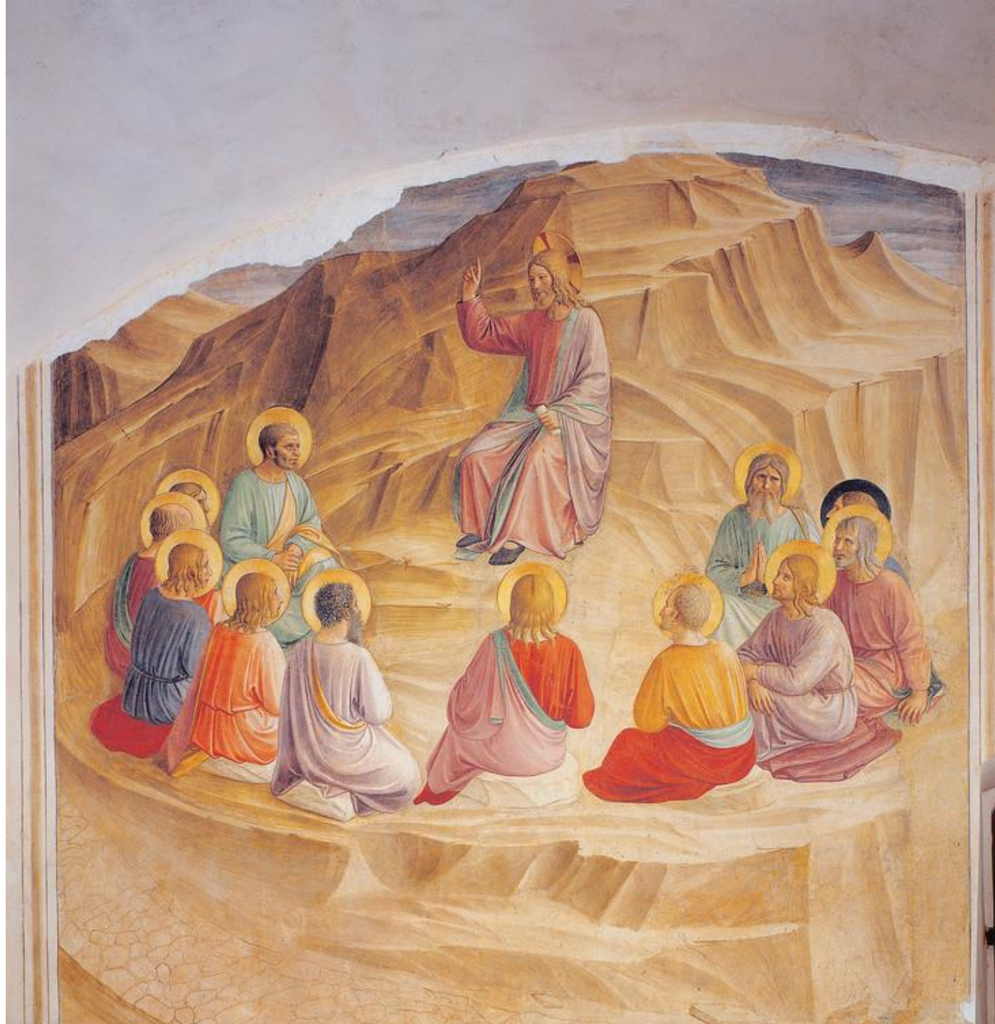
Fra Angelico ~1430