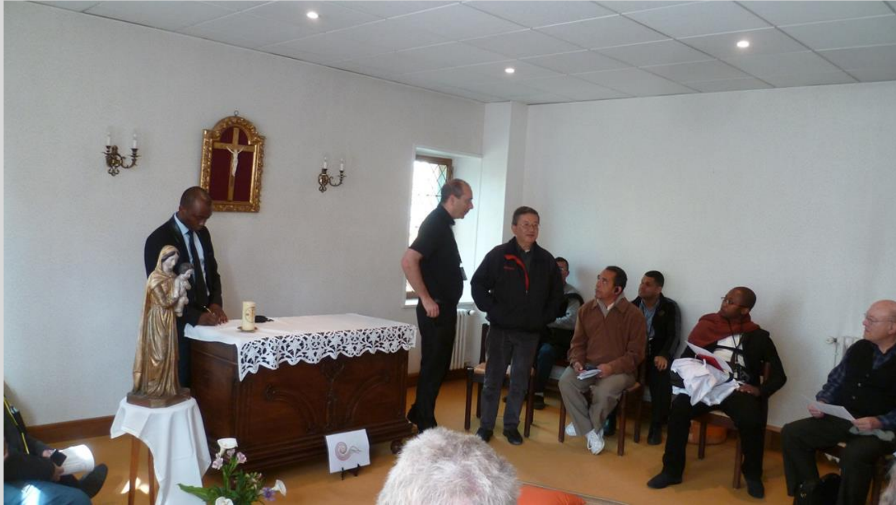
Chambre de saint Jean Eudes