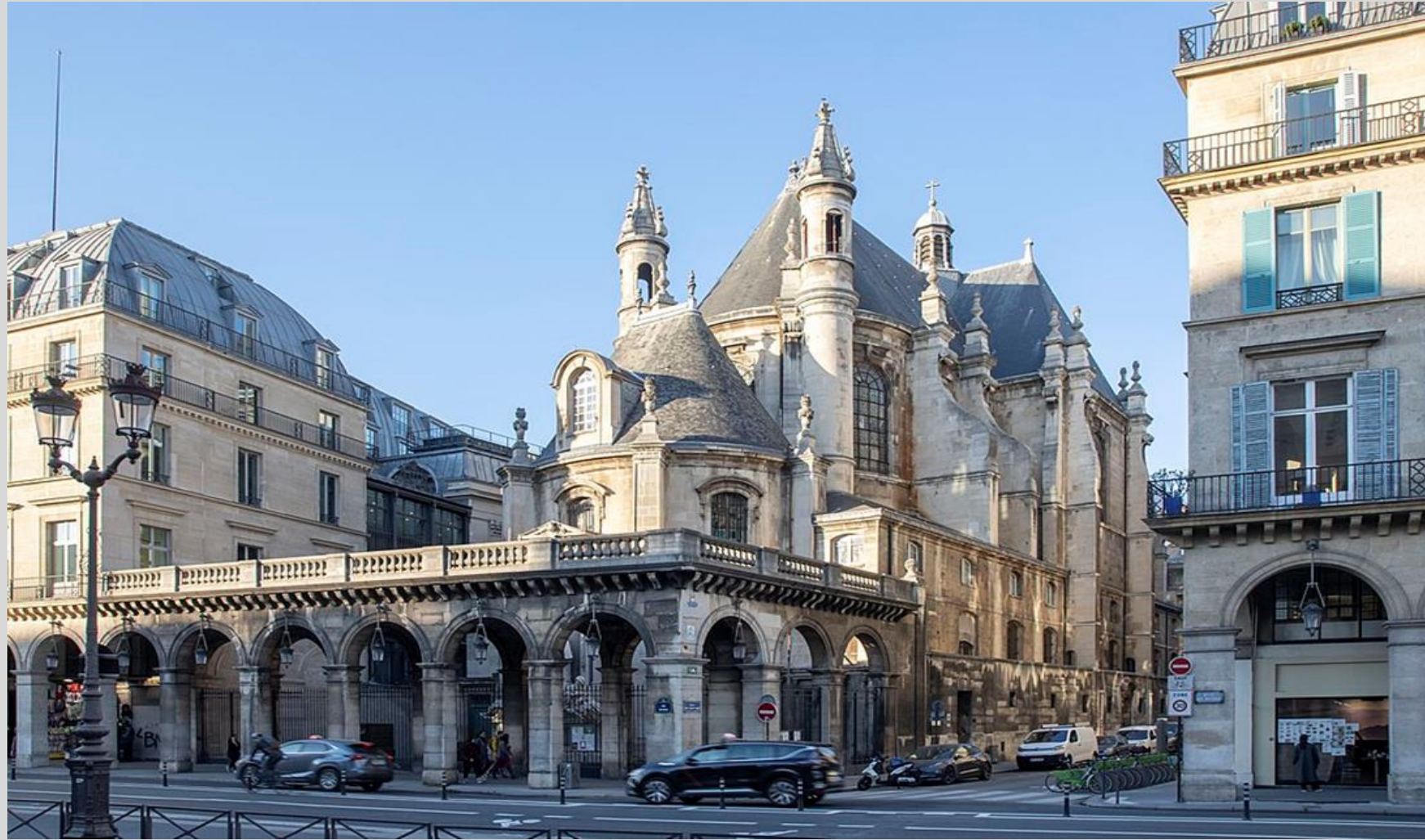
Temple de l'Oratoire